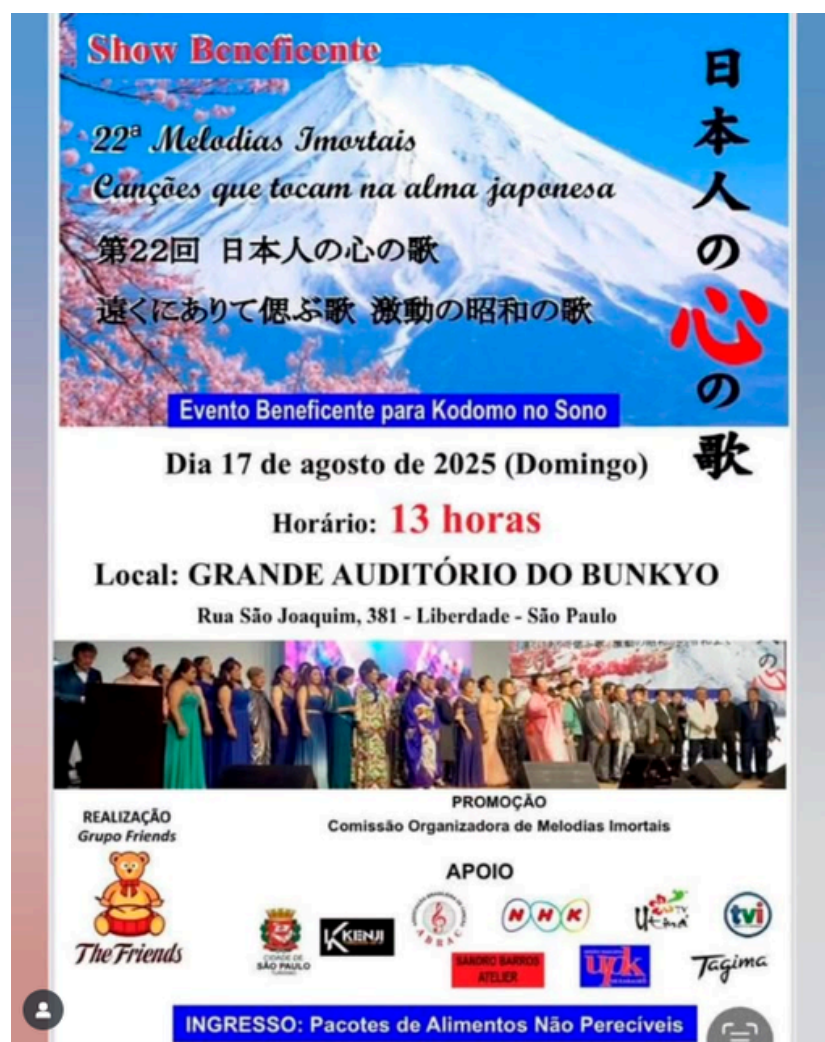
[CLIQUE NA IMAGEM PARA IR NO POST] 22ª Melodias Imortais - Show Beneficente em SP Canções que tocam na alma japonesa