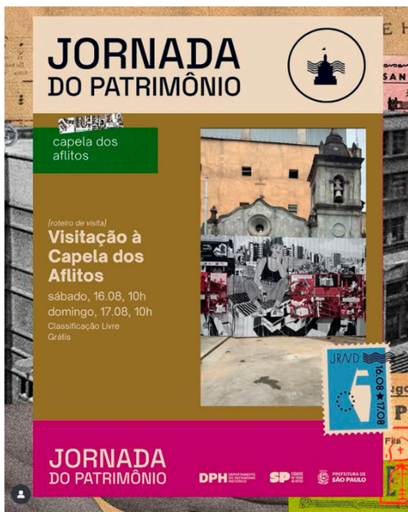
[CLIQUE NA IMAGEM PARA IR NO POST] Na Jornada do patrimônio 2025 teremos visita à Capela dos Aflitos.