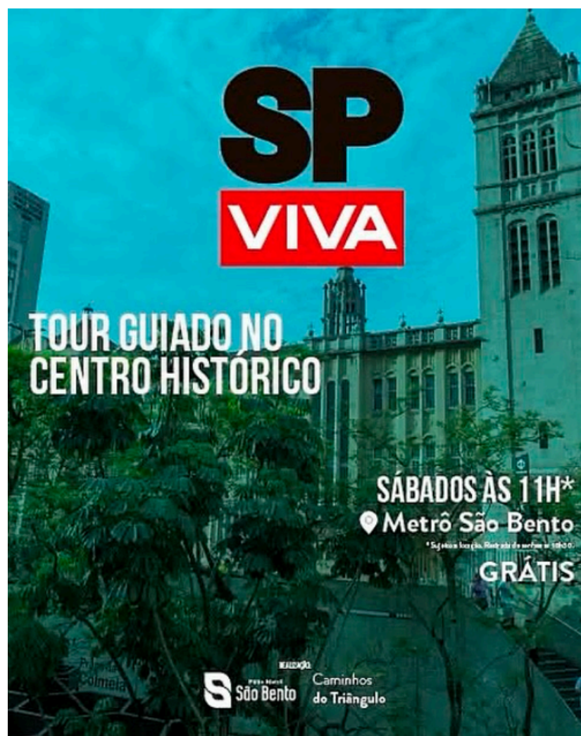
[CLIQUE NA IMAGEM PARA IR NO POST] Em Agosto o Tour Destaques do Centro Histórico ta de volta na programação do Pátio!