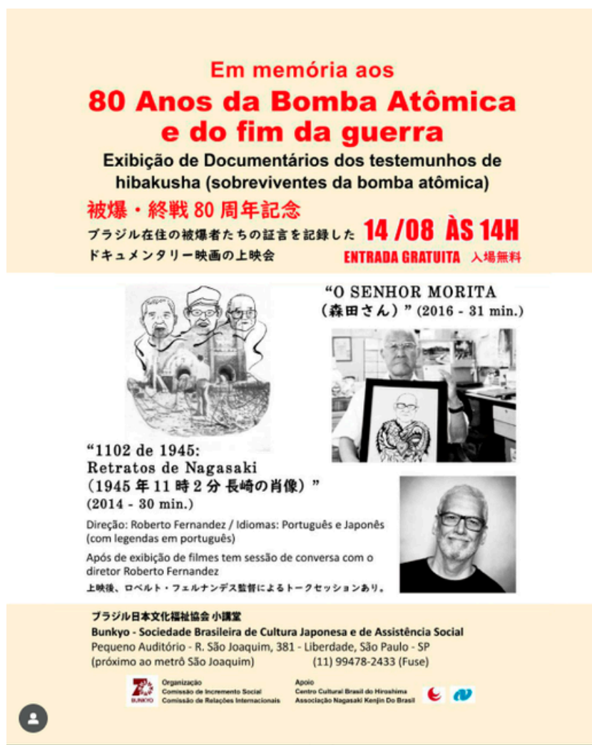
[CLIQUE NA IMAGEM PARA IR NO POST] Em memória aos 80 anos da Bomba Atômica e o final da guerra” (São Paulo-SP).